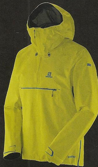
SLAB X ALP ANORAK M