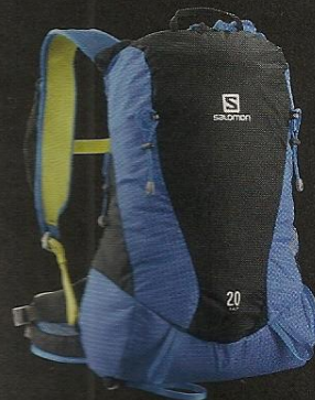
SLAB X ALP 20