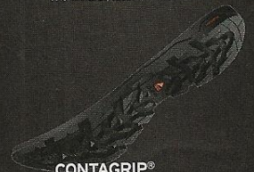
CONTAGRIP® Grip und Haltbarkeit dank einer neuen Materialzusammensetzung und Sohlengeometrie, die für Flexibilität sorgen.