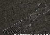
CARBON EDGING CHASSIS Eine patentierte Sohlenkonstruktion liefert hervorragende Flexibilität bei maximaler, lateraler Stabilität.