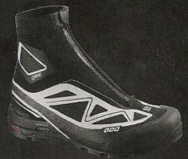
X ALP CARBON GTX